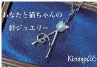
所在地: 松山市一番町2-5-15 一番館ビル5階

電話: 089-993-8466 *アトリエは完全予約制。オーダーは指輪、ペンダント、イヤリング、ブローチなどさまざまなアクセサリーに対応。帯留め、社章なども。Kizunya26の価格は4万円前後。