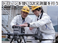
ドローンを使い3次元測量を行う ネパールのオフショア拠点