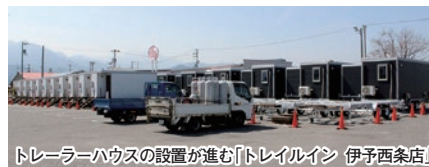
トレーラーハウスの設置が進む「トレイルイン 伊予西条店」

客室は全29室。セミダブルベッドを備えた1〜2人利用の客室18室、ダブルベッドとソファを備えた4人利用の客室8室、ツインベッドと2段ベッド、ソファ