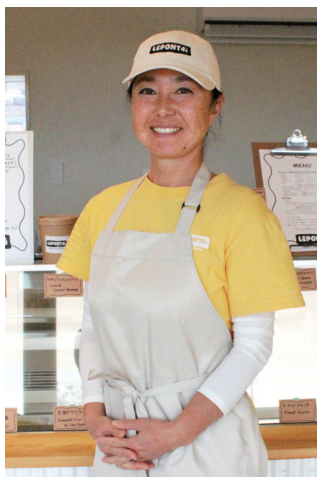
LEPONT4è (ルボン・キャトリエム)