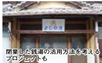
閉業した銭湯の活用方法を考えるプロジェクトも