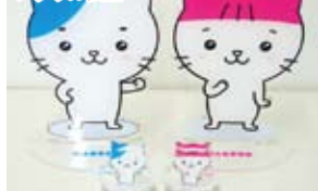
同社のオリジナルキャラをあしらったアクリル製品