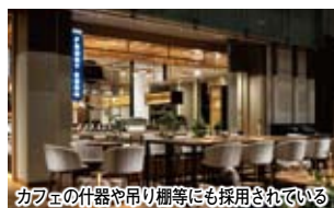
カフェの什器や吊り籠等にも採用されている

2019年に自社の生産設備と培った技術を生かし、多様な素線で正方形の格子を形成する「レティココ」と、らせん形状の「スカッリア」シリーズをオリジナルのデザイン金網として市場投入した。近年では福岡市の都市開発エリアにある「天神ビジネスセンター」のアトリウムにブロンズとステンレスを組み合わせた「レティココ」と、らせん形状の「スカッリア」シリーズをオリジナルのデザイン金網として市場投入した。