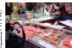
フィンランドで売られると、サウモンがほとんど。魚は会員として募る。

新たに同国でビジネスをしたい起業家や販路を開拓したい企業も歓迎。「例えば食では日本料理への関心が高いが、現地には中国人が経営するすし店やうどん店があるだけで、本当の日本の味を知らない。チャンスがある」とする。入会資格は特にないが、代表理事の承認が必要。入会金と年会費は、中小企業の場合でそれぞれ1万円と2万円。近くHPを開設する予定。 経済に加え文化・スポーツの交流や、愛媛の子どもや若者が国際感覚を身に付けられるような事業も行う。また、戦争や災害等の有事の際には愛媛から同国への支援の窓口としての役割も担う。