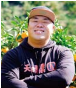
1991年5月12日生まれ、法活中。農園に入社している。「絶対質も視野に入れている」

天晴農園は、西予市明浜町の若手柑橘農家4人が2020年に結成した生産者グループ。明浜みかんを後世に残したい、明浜みかん地域を盛り上げたいとの思いで立ち上げた。「笑顔になれる